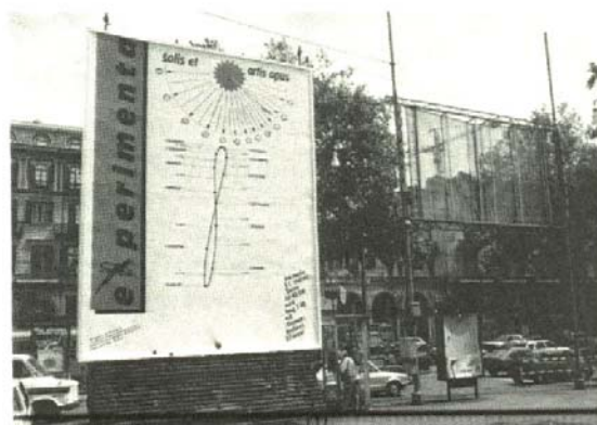
Fig. 3-31a Torino, presso stazione di Porta Nuova: Quadrante Solare ad Ore Medie Fuso in fase di montaggio.